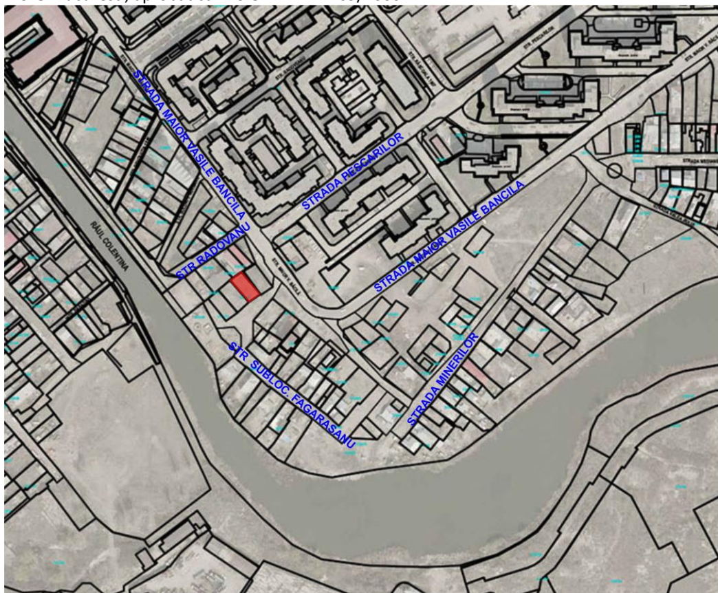
Plan reambulare PUZ Sector 2 – documentatie in curs de avizare