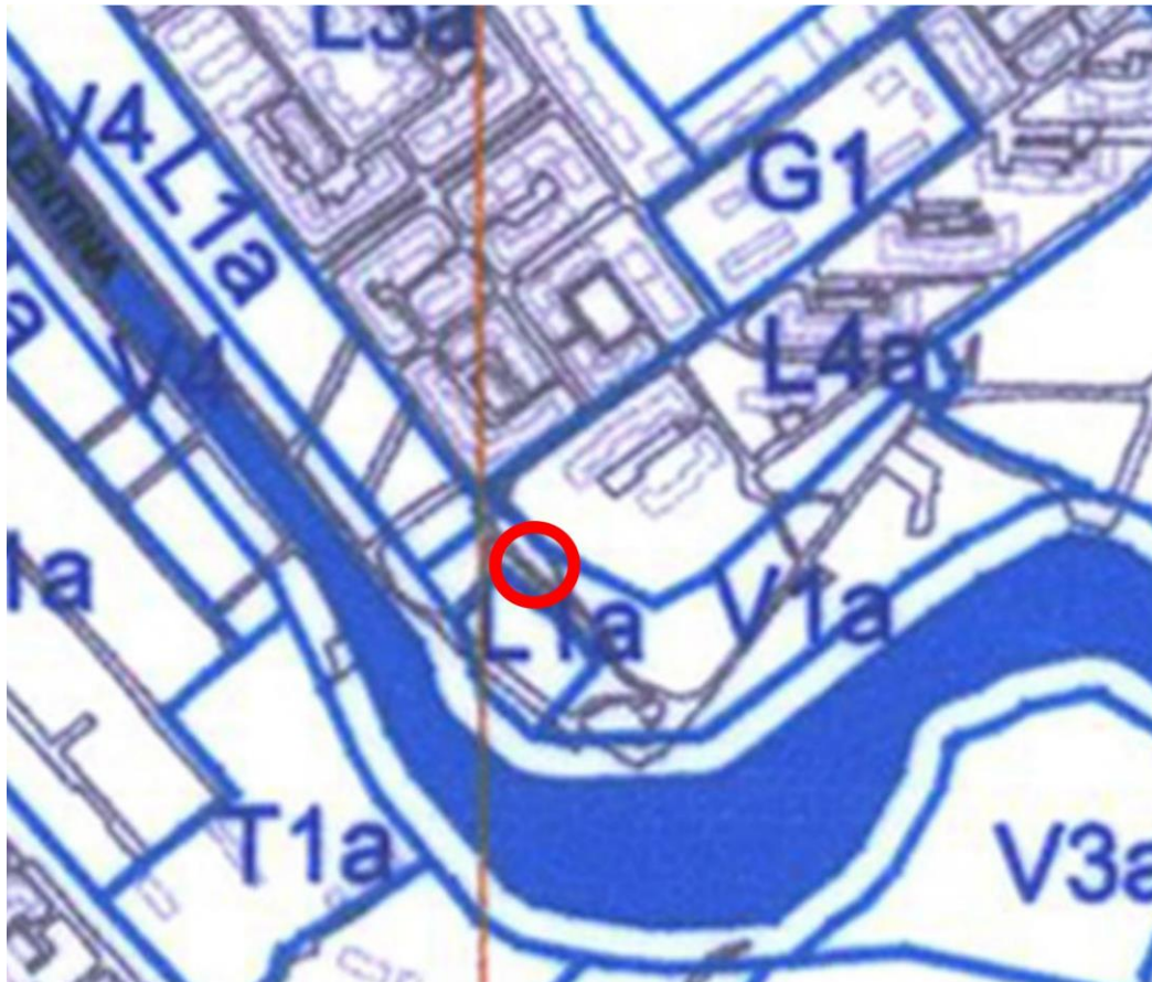
P.U.G. Bucuresti, aprobat cu H.C.G.M.B. nr. 269/2000